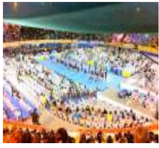
マリネラ・コンクール風景