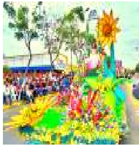
パレード・フェスティバル

【ラティエノがお勧めするプランのポイント！】 *安心の日本語ガイド同行プラン！(トルヒーヨは英語ガイド) *世界遺産・リマ、ナスカの地上絵観光へご案内いたします *本場トルヒーヨにてマリネラコンクール最終日 決勝ファイナルを鑑賞いただけます！