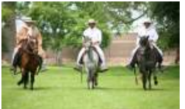
カパージョデパソ(イメージ)