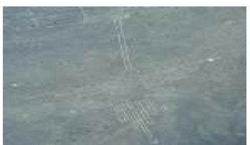
ナスカの地上絵(ハチドリ)